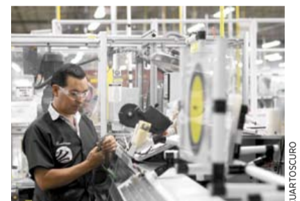
MÉXICO, EN TOP 10 POR SU CAPTACIÓN DE IED ➤DINERO 13