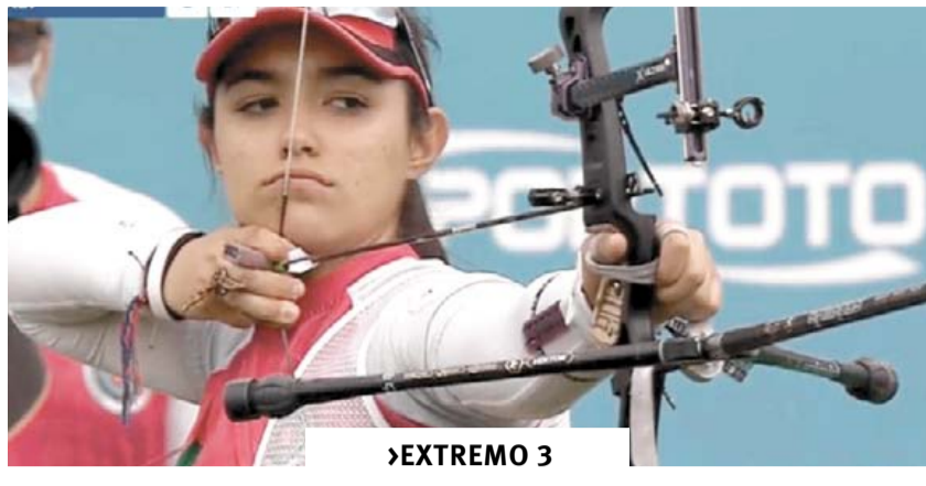
➤EXTREMO 3 EN TIRO CON ARCO POR EQUIPOS, COAHUILENSE CONSIGUE BOLETO PARA JUEGOS OLÍMPICOS DE TOKIO