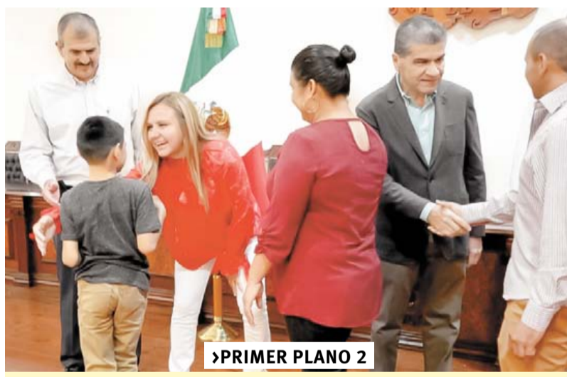
➤PRIMER PLANO 2 COAHUILA, ESTADO DE AVANZADA EN MODELO DE ADOPCIONES

La FGE y el IEC aumentaron sus ingresos recibidos por parte de la administración estatal.