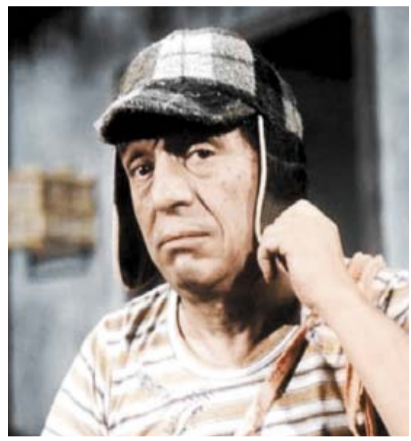
CUMPLE 'EL CHAVO DEL 8' 50 AÑOS DE SU ESTRENO ➤VMÁS