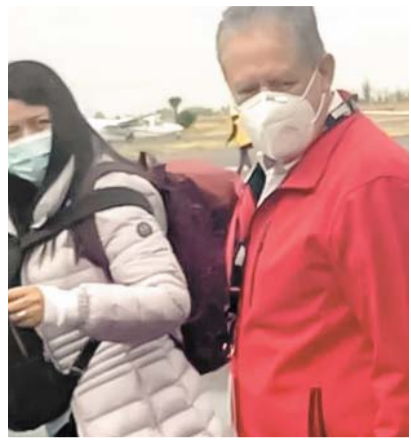
PASAN DE AYUDAR A AMLO A CARGOS DE ALTO NIVEL ➤RUMBO NACIONAL 4