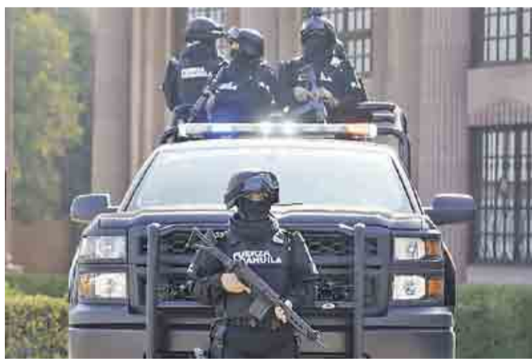
Expedientes. La corporación policiaca es la más denunciada.

Los datos indican que desde su inicio en marzo de 2016 hasta enero de este año, la CDHEC tiene registrados más de 10 tipos de violaciones diferentes entre las que se encuentran allanamientos, lesio-