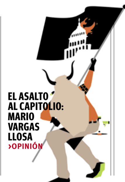
EL ASALTO AL CAPITOLIO: MARIO VARGAS LLOSA ▶OPINIÓN