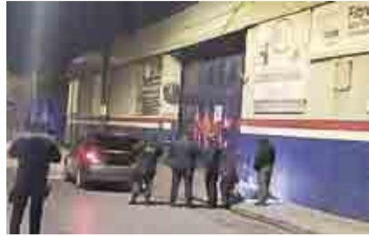
HALLAN RESTOS HUMANOS EN CALLES DE SALTILLO ▶PRIMER PLANO 2