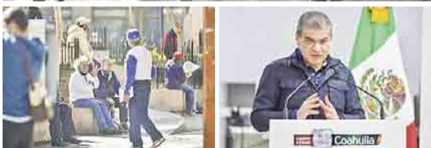
Persiste. En las calles siguió una alta afluencia en algunos casos sin respetar las medidas. Riquelme afirmó que se analizará según los datos de cada región.

que esto no obliga a tomar medidas similares en toda la entidad.