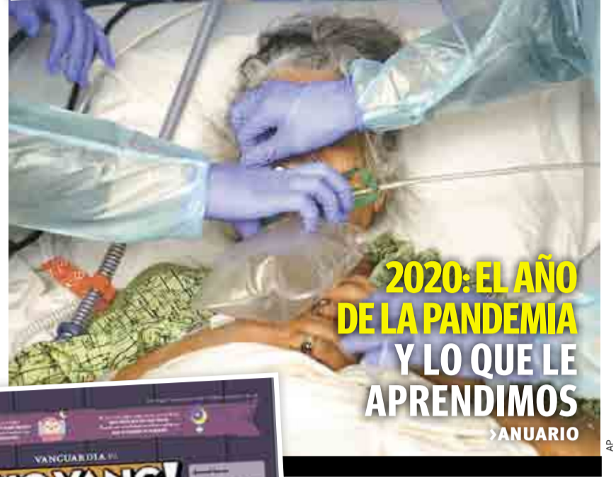
2020: EL AÑO DE LA PANDEMIA Y LO QUE LE APRENDIMOS ▶ANUARIO

ABRE FGR A MEDIAS EL EXPEDIENTE DE SALVADOR CIENFUEGOS ▶R. NACIONAL 6