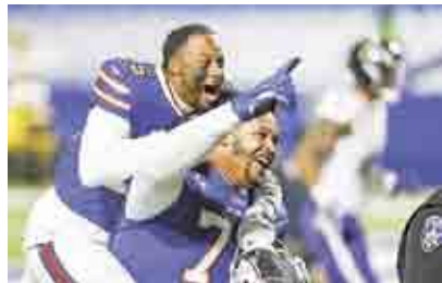
EMBISTEN BILLS A LOS RAVENS; RODGERS ENCAMINA A PACKERS ▶EXTREMO