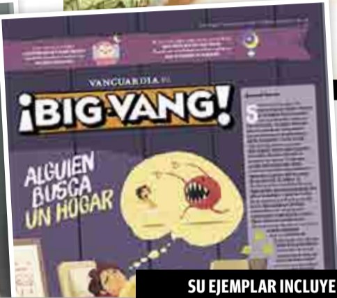
SU EJEMPLAR INCLUYE