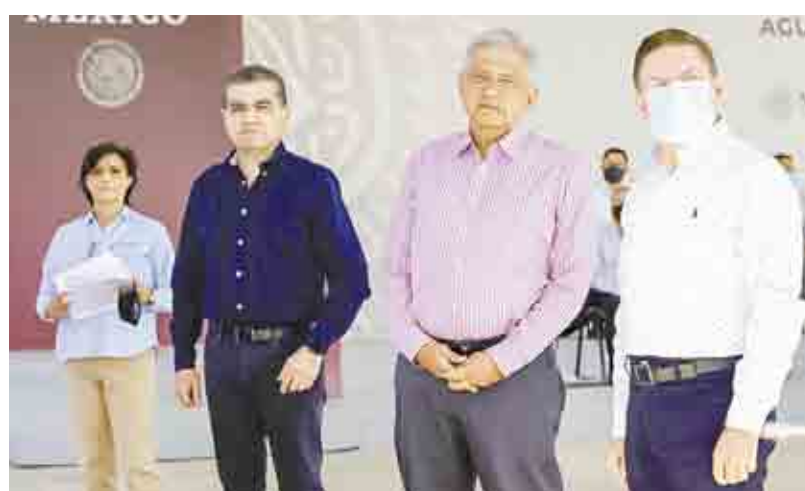
Visita. Riquelme recibió ayer a López Obrador en La Laguna, en donde presentaron este importante proyecto en materia de agua.

para La Laguna, el cual consideró resolverá este añejo problema.