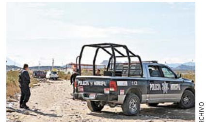
Impune. Autoridades no cuentan con datos del responsable.

Aunque la Fiscalía indicó que la necropsia mostró que la menor