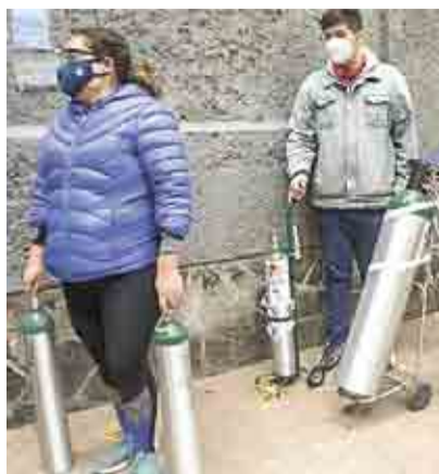
LUCRAN SUBARRENDADORES CON TANQUES DE OXÍGENO ➤MI CIUDAD