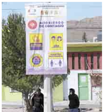
Los pendones fueron colocados en zonas en las que se registran aglomeraciones.

Actualmente la ocupación hospitalaria de la Región Sureste de Coahuila comprendida por los municipios de Saltillo, Parras de la Fuente, General Cepeda, Ramos Arizpe y Arteaga se encuentra al 45 por ciento con 194 camas de COVID-19 en uso de las 433 existentes, mientras que de los 132 ventiladores existentes, 35 se encuentran ocupados.