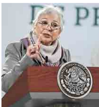
VAN POR REGULACIÓN A REDES SOCIALES; ENVIARÁN PROPUESTA ➤RUMBO NACIONAL 8