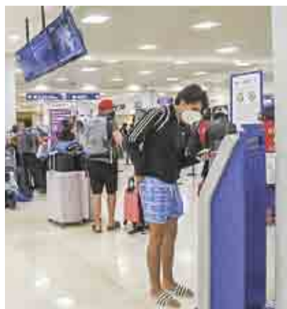
MÉXICO, DE LOS PAÍSES SIN RESTRICCIONES A VIAJEROS ➤RUMBO NACIONAL 10