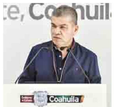
RESPALDAN A EMPRESARIOS CON MIL MDP EN CRÉDITOS ➤PRIMER PLANO 2

“Acudiremos a la Suprema Corte de Justicia de la Nación en acción de inconstitucionalidad para demostrar la violación a los principios de derecho a un medio ambiente sano”, decretó la dirigencia del PRI. Con información de El Universal ➤RUMBO NACIONAL 8