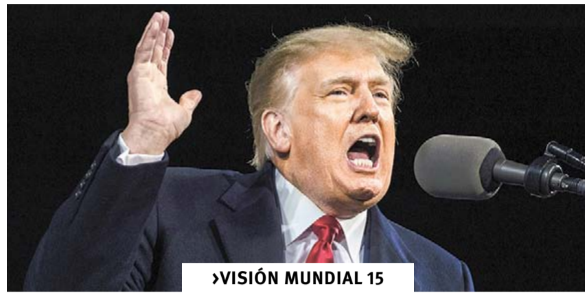
VISION MUNDIAL 15

DEFINE PRI A SUS 'GALLOS' PARA CANDIDATURAS A DIPUTACIONES FEDERALES Y ALCALDÍA DE SALTILLO