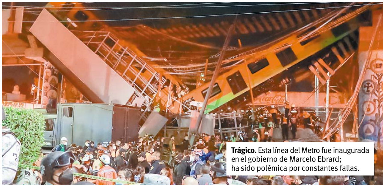
Trágico. Esta línea del Metro fue inaugurada en el gobierno de Marcelo Ebrard; ha sido polémica por constantes fallas.