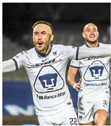
PUMAS SE LEVANTA Y VA A LA FINAL CONTRA LEÓN >EXTREMO 2