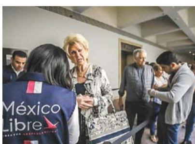
PARA 2021, MÉXICO LIBRE VA POR ALIANZA CON EL PAN >RUMBO NACIONAL 5