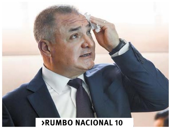
►RUMBO NACIONAL 10

40 páginas en 6 secciones • #16,020 • Ejemplar: 10.00 pesos