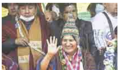
A UN AÑO DE SU EXILIO, EVO MORALES VUELVE A BOLIVIA > VISIÓN MUNDIAL 15