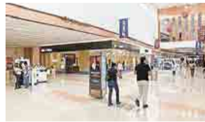
INICIA EL BUEN FIN 2020 CON ESTRUCTIVOS PROTOCOLOS > MI CIUDAD 2/ PRIMER PLANO 10