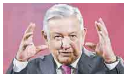
AMLO CREE IMPRUDENTE FELICITAR A JOE BIDEN > RUMBO NACIONAL 8