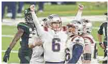
EN REÑIDO JUEGO, PATRIOTAS VENCEN A LOS JETS DE NY > PRIMER PLANO 10