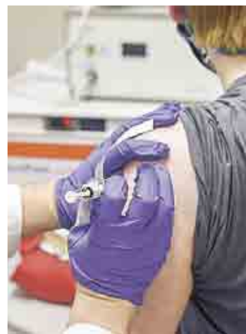
Preven una producción de 50 millones de dosis en 2020 y mil 300 millones en 2021.

también registró avances. Por su parte, empresas que se beneficiaron con el confinamiento, como es el caso de la plataforma de videoconferencias Zoom, tuvieron una caída. Por su parte, el presidente de Estados Unidos, Donald Trump, criticó que el anuncio de la vacuna no se realizara antes de las elecciones presidenciales del pasado 9 de noviembre. Con información de agencias