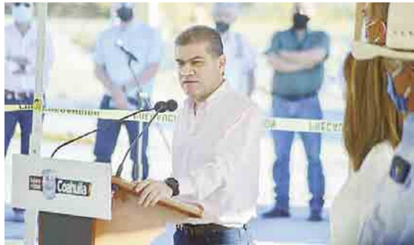
BUSCAN ELEVAR BIENESTAR DE LOS COAHUILENSES > PRIMER PLANO 10

2. Policías balean a periodistas que cubrían protesta contra los feminicidios en Cancún. > RUMBO NACIONAL 11