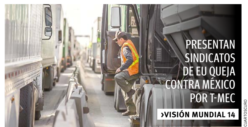
PRESENTAN SINDICATOS DE EU QUEJA CONTRA MÉXICO POR T-MEC