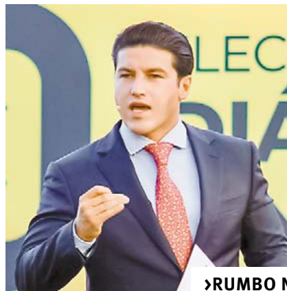
►RUMBO NACIONAL 8

DÍA DE LAS MADRES, 'BOCANADA DE AIRE FRESCO' PARA RESTAURANTES DE SALTILLO