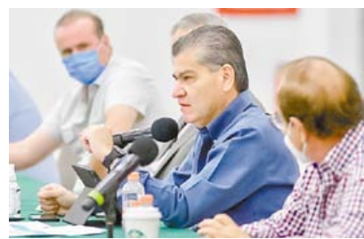
Ayer se dieron a conocer detalles del regreso a clases presenciales.

Riquelme insistió en que estarán pendientes de los síntomas de los niños, y que serán muy estrictos con los protocolos de higiene para la tranquilidad de toda la ciudadanía, principalmente de los involucrados en el sector. Hoy iniciará la capacitación de es-