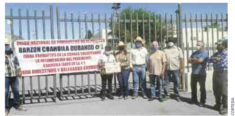
Molestia. Productores se quejaron de la falta de acceso a programas.

De acuerdo con los ejidatarios que ayer manifestaron sus inconformidades ante Conaza, son más de 20 comunidades de Saltillo las afectadas por designaciones como esta; es decir, donde existe un solo beneficiario vinculado con las autoridades.