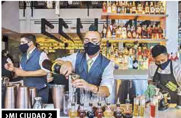
MI CIUDAD 2

32 páginas en 5 secciones • #15,901 • Ejemplar: 10.00 pesos