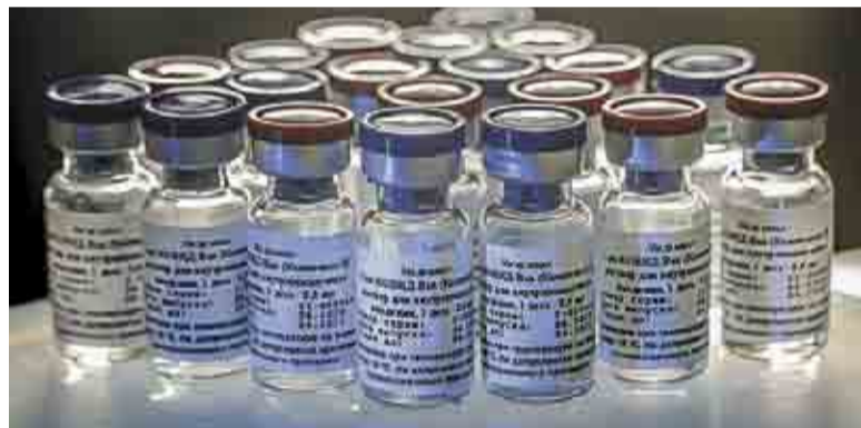
Pruebas. En EU ya están aplicando algunos prototipos en voluntarios.