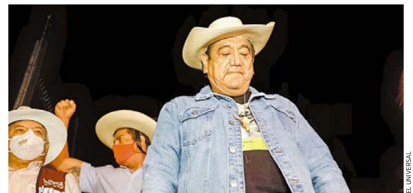
Lo batean. Los consejeros del INE mantuvieron su decisión de no aceptar el registro, luego de no reportar gastos de precampaña.

De acuerdo con las redes sociales del Movimiento, hay 76 sedes en todo el país en las cuales habrá marcha para exigir la vacuna.