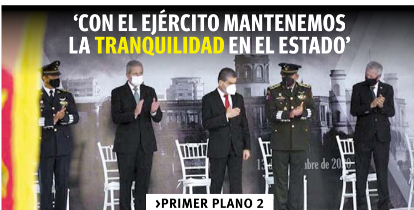
'CON EL EJÉRCITO MANTENEMOS LA TRANQUILIDAD EN EL ESTADO'

EL DÉFICIT EN LA PANDEMIA de puestos de trabajo, respecto a febrero (780,681).