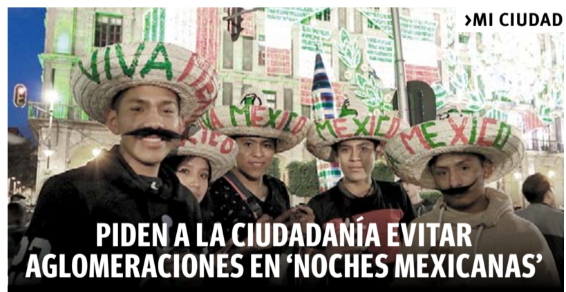
PIDEN A LA CIUDADANÍA EVITAR AGLOMERACIONES EN 'NOCHES MEXICANAS'