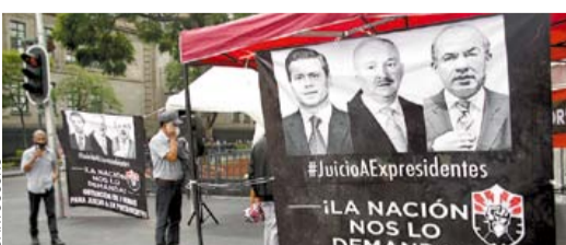
LE FALTAN A MORENA 800 MIL FIRMAS PARA 'ENJUICIAR' A EXPRESIDENTES

Hasta julio de este año se han abierto 23 investigaciones en Coahuila por el presunto delito de extorsión, cifra que rebasa los 20 casos registrados en el mismo periodo de 2019, según el Secretario Ejecutivo del Sistema Nacional de Seguridad Pública.