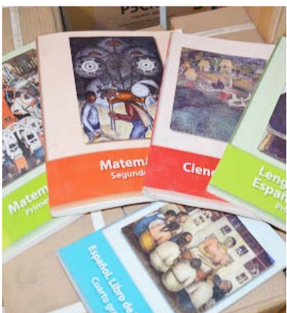
FALTAN POR LLEGAR 40 MIL LIBROS; CLASES EN AULAS, AÚN SIN FECHA