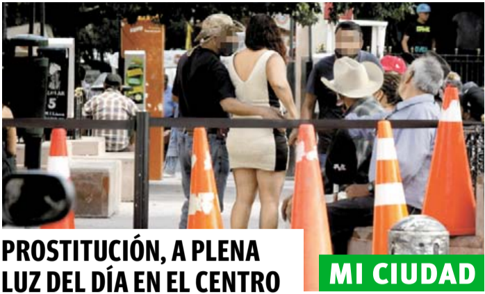
PROSTITUCIÓN, A PLENA LUZ DEL DÍA EN EL CENTRO