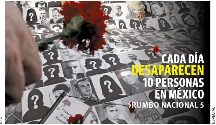
CADA DÍA DESAPARECEN 10 PERSONAS EN MÉXICO