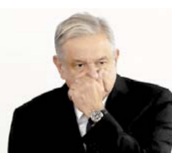
RIVA PALACIO ¿ENGAÑARON A AMLO CON EL CASO LOZOYA?