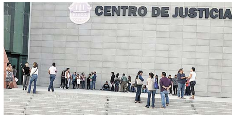
Apoyo. Compañeros del sindicato de los acusados se manifestaron en forma pacífica afuera del Centro de Justicia.