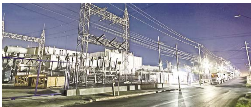
Todavía por la noche algunas empresas no tenían energía eléctrica.

Elo ocasionó pérdidas millonarias, aún no cuantificadas, al sector