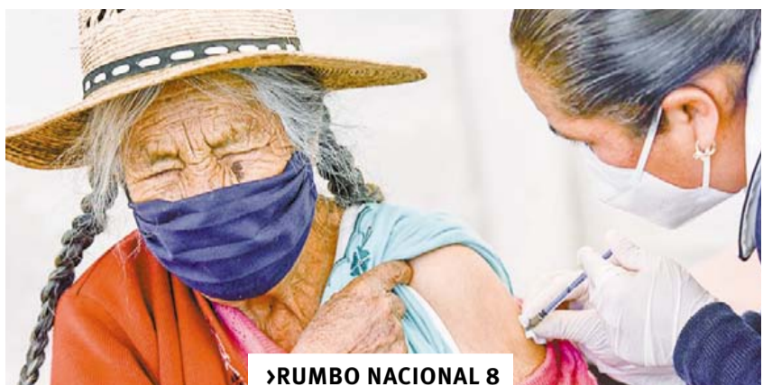
➤ RUMBO NACIONAL 8 APLICAN 23 MIL 369 DOSIS EN INICIO DE VACUNACIÓN MASIVA DE ADULTOS MAYORES EN MÉXICO

36 páginas en 6 secciones • #16,014 • Ejemplar: 10.00 pesos