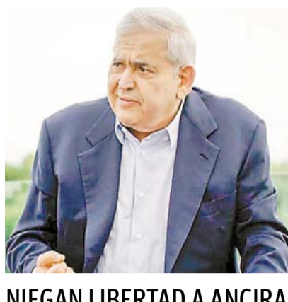
NIEGAN LIBERTAD A ANCIRA Y PROTEGEN SUS BIENES ➤ RUMBO NACIONAL 8