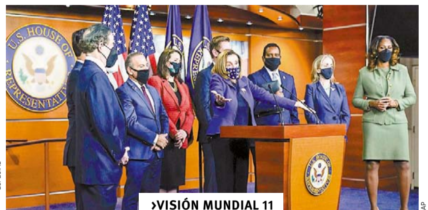
➤ VISIÓN MUNDIAL 11 INVESTIGARÁ UNA COMISIÓN INDEPENDIENTE EL ATAQUE AL CAPITOLIO EN ESTADOS UNIDOS