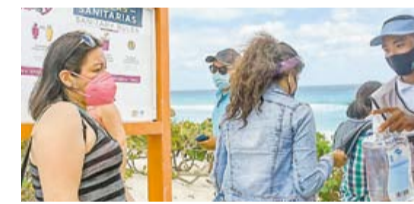
PANDEMIA BORRÓ 200 MIL EMPLEOS TURÍSTICOS ➤ DINERO 10