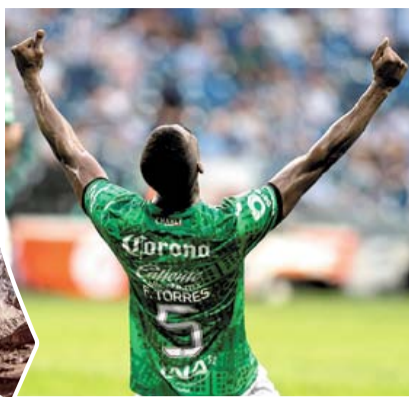
AGÓNICO PASE DE SANTOS; PACHUCA ECHA AL AMÉRICA >EXTREMO