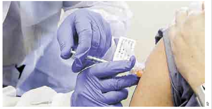
Una buena. Moderna y Pfizer han anunciado ensayos exitosos hasta el momento para tener en breve una vacuna contra el coronavirus.

Expertos consideran que la nueva tecnología detrás de las vacunas contra el coronavirus de Pfizer y Moderna podría usarse para pre-