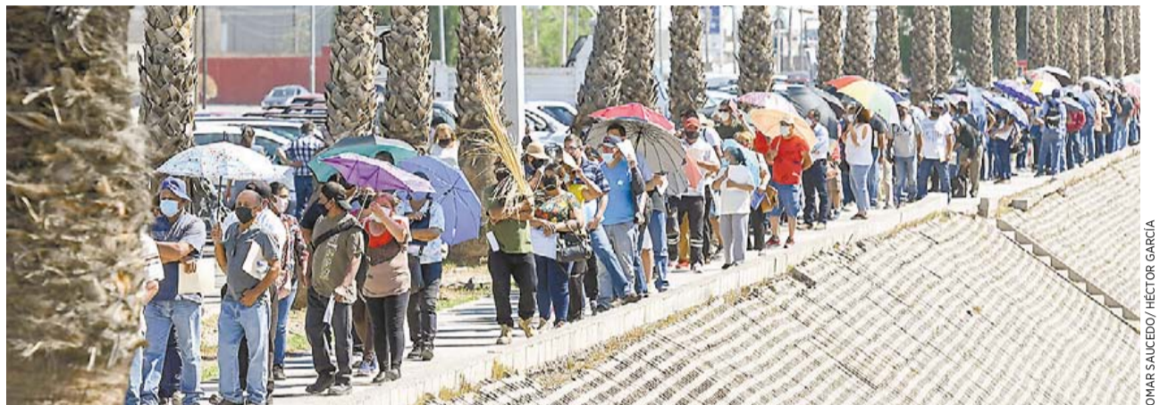
A merced del clima. Cientos de saltillenses pasaron horas bajo el sol en el módulo de Canacintra.

Las mujeres embarazadas, al considerarse un sector de la población vulnerable, se les permitía el acceso al interior sin realizar la fila kilométrica que realizó el resto