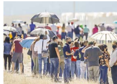
Como pueden. Las autoridades no previeron colocar toldos u otro equipo.