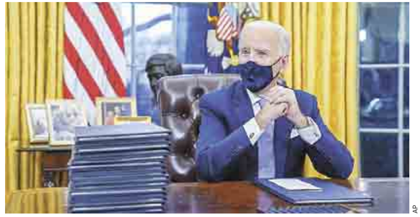
Arranque. Una nueva etapa de Estados Unidos comenzó ayer con el primer día de gobierno de Joe Biden, quien marcó distancia con Trump.

También en su primera jornada como presidente, Biden firmó una orden ejecutiva para salvaguardar el programa DACA, que protege de la deportación a unos 650 mil indocumentados que llegaron a Estados Unidos cuando eran niños, conocidos como “soñadores”. Asimismo suscribió otro decreto que ordena detener