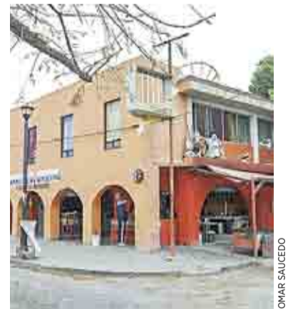
TEME COMERCIO DE ARTEAGA QUIEBRAS ANTE CIERRE >MI CIUDAD