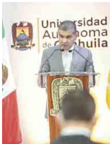
REDOBLAN ESFUERZOS EN SALUD Y REACTIVACIÓN >PRIMER PLANO 2

Al menos 21 alcaldes de Coahuila, entre ellos de municipios como Saltillo, Torreón y Monclova, estaban en el supuesto de beneficiarse con una posible segunda reelección.