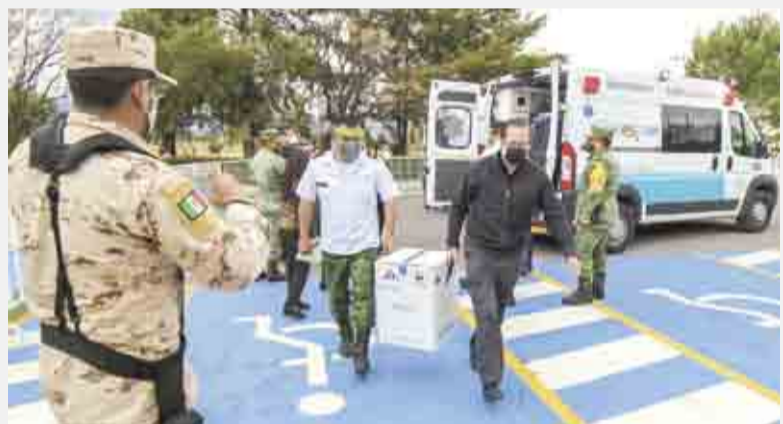
Arribo. Las dosis que llegaron, serán destinadas para el personal médico.

Además, en el 19.46 por ciento de fallecidos, lo que representó a 916 personas, no se identificó si tuvo