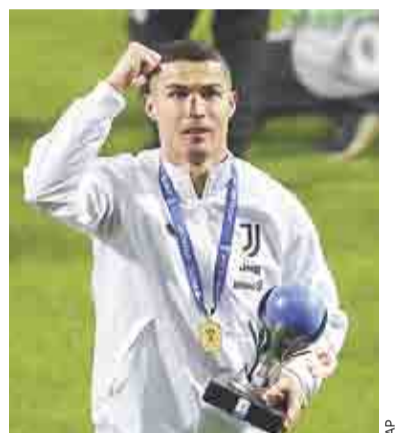
ES CRISTIANO EL MÁXIMO GOLEADOR EN LA HISTORIA >PRIMER PLANO 2