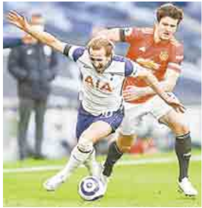
TAMBALEA LIGA DE GIGANTES: SE BAJAN CLUBES INGLESES ▶ EXTREMO