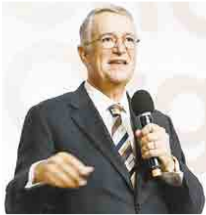
'NO TENGO MOTIVOS PARA ASPIRAR A PRESIDENCIA' ▶ PRIMER PLANO 2