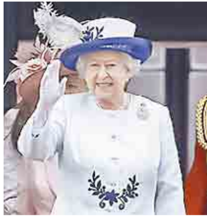
ISABEL II: 95 AÑOS ENTRE EL DRAMA Y LA GLORIA ▶ VMÁS