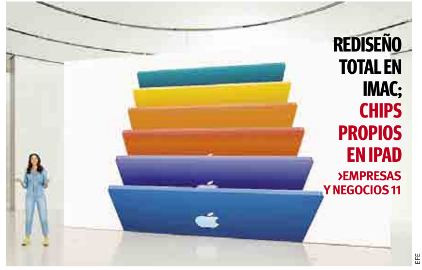
REDISEÑO TOTAL EN IMAC; CHIPS PROPIOS EN IPAD ▶ EMPRESAS Y NEGOCIOS 11