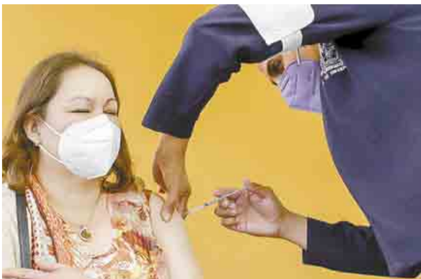
ARRANCA INMUNIZACIÓN DE MAESTROS: SE APLICAN MÁS DE 19 MIL DOSIS ▶ MI CIUDAD 1, 2 Y 6

Riquelme adelantó que confía que en este mismo ciclo escolar se pueda regresar a clases presenciales , y que podría ser en algunas escuelas en el modelo híbrido, y en otras ya como plan piloto en el formato presencial; pero todo ello deberá ser con responsabilidad y valorando todos los aspectos, priorizando siempre la salud de las y los alumnos y del personal educativo de Coahuila.