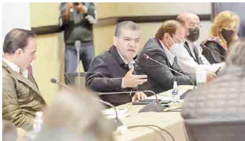
REFUERZAN ESTRATEGIA EN SALUD Y REACTIVACIÓN ▶ PRIMER PLANO 2

"Es un logro porque se concreta este acuerdo después de meses de trabajo donde se escuchan todas las partes, (...) se logra saldar una deuda histórica con muchos trabajadores de México" , expresó. Con información de El Universal y Armando Ríos ▶ RUMBO NACIONAL 5