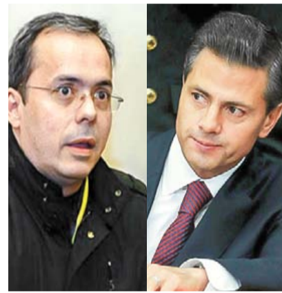
Señalados. Rendón y EPN aparecieron en un reporte por lavado de los EU.

Otro caso que se cita es el vinculado a Omar Treviño Morales, líder de Los Zetas. En 2014, el banco Standard Chartered Bank de Nueva York procesó 172 transferencias por 5 millones 16 mil dólares, las cuales salían