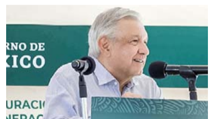
PIDE ACTUAR PENSANDO EN PUEBLO EN CONTRARREFORMA ►RUMBO NACIONAL 4

entidad, ya suman 8 mil 584 personas que han sido inmunizadas contra el COVID-19; se tiene considerado aplicar 20 mil 800 dosis.