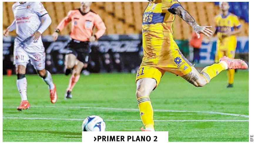
DESPIERTA TIGRES CON 'DIENTE' AFILADO ►PRIMER PLANO 2