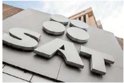
FACTURABAN MIL 099 MDP CONTRIBUYENTES DE 100 AÑOS ►PRIMER PLANO 2