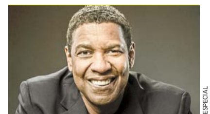
YO NO ELEGÍ LA ACTUACIÓN, ELLA ME ELIGIÓ A MÍ: DENZEL ►VMÁS