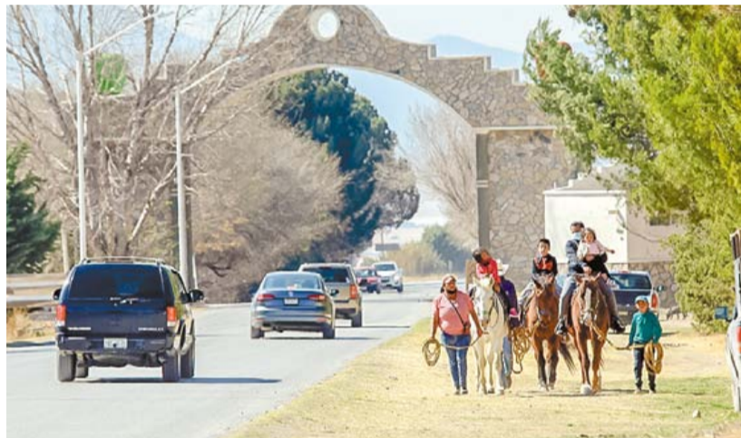
Movimiento. Pobladores de comunidades rurales de Arteaga afirman que más gente de Saltillo y Monterrey ha estado acudiendo en los últimos días.

Aunque al inicio se requería del registro previo en la plataforma federal, los solicitantes también tie-