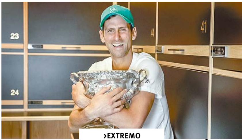
DJOKOVIC, CERCA DEL OLIMPO DE 20 TÍTULOS ►EXTREMO