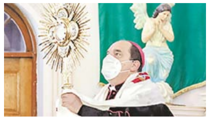
DA OBISPO DE SALTILLO ROTUNDO 'NO' AL ABORTO ►MI CIUDAD