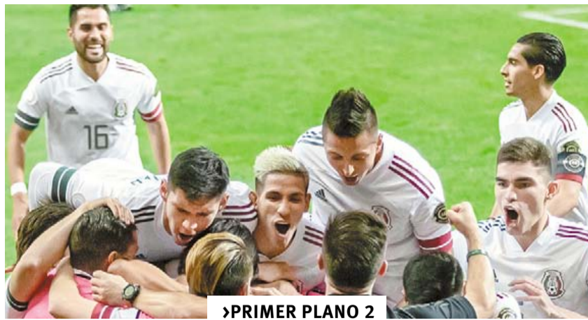
DAN PASO POR BOLETO A LOS OLÍMPICOS