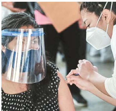
A CASI 3 MESES DE VACUNACIÓN, SÓLO 0.56% ESTÁ INMUNIZADO ▶PRIMER PLANO 2