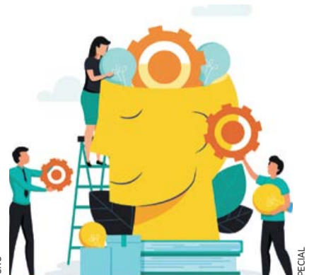
CON SECUELAS PSICOLÓGICAS, 73% DE INTERNADOS COVID ▶MI CIUDAD 6