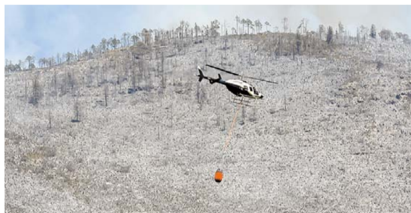
Avance. Las autoridades realizaron ayer 92 descargas de aguas con supresor de calor; más de 480 elementos siguen combatiendo el fuego.

800 VEHÍCULOS fueron regresados en los cuatro filtros instalados.