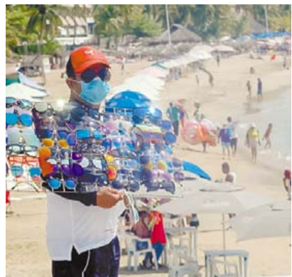
EN SEMANA SANTA PREVEN DERRAMA DE 12.2 MIL MDP ▶DINERO 13