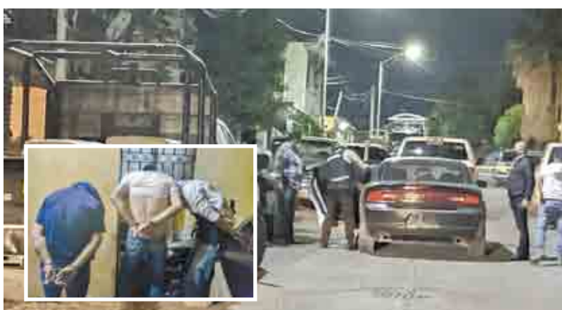
Libertação. Agentes municipales fueron los primeros en acudir a este operativo para poner a salvo al hombre que estaba secuestrado.