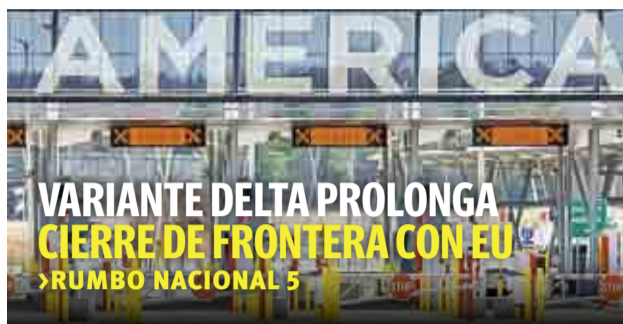
VARIANTE DELTA PROLONGA CIERRE DE FRONTERA CON EU >RUMBO NACIONAL 5