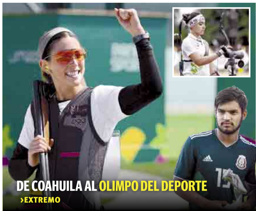
DE COAHUILA AL OLIMPO DEL DEPORTE >EXTREMO