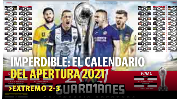
IMPERDIBLE: EL CALENDARIO DEL APERTURA 2021 >EXTREMO 2-3 GUARDIANES