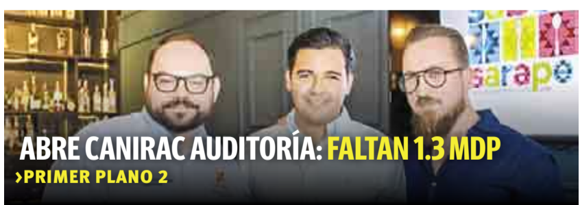
ABRE CANIRAC AUDITORÍA: FALTAN 1.3 MDP >PRIMER PLANO 2

Autoridades de Salud anticiparon que en próximos días se tendrá una reunión con directivos de las clínicas privadas para conocer el número de camas especializadas en COVID-19 que mantienen en operación.