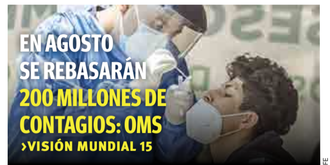
EN AGOSTO SE REBASARÁN 200 MILLONES DE CONTAGIOS: OMS >VISIÓN MUNDIAL 15