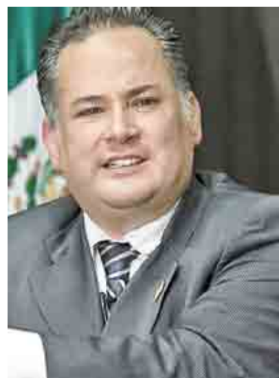
GASTARON EPN Y FCH 6 MIL MDP EN ESPIONAJE >RUMBO NACIONAL 4

1. 'Viejos', la nueva película protagonizada por Gael García; su director, en entrevista. >MÁS