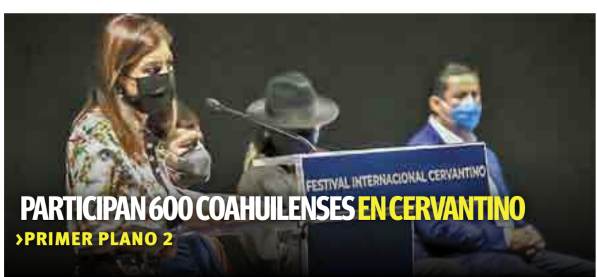
PARTICIPAN 600 COAHUILENSES EN CERVANTINO >PRIMER PLANO 2