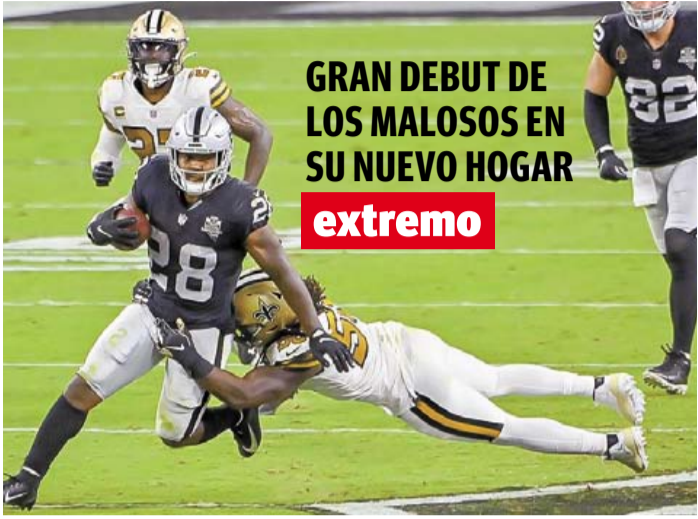
GRAN DEBUT DE LOS MALOSOS EN SU NUEVO HOGAR extremo

40 páginas en 6 secciones • #15 943 • Ejemplar: 10.00 pesos