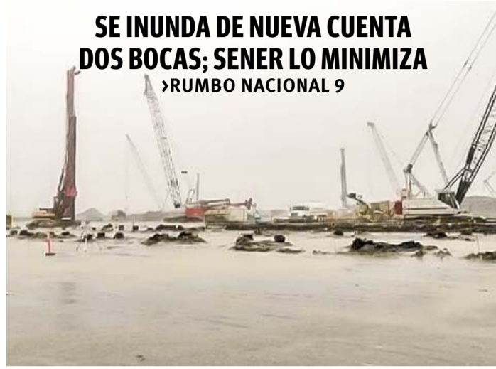
SE INUNDA DE NUEVA CUENTA DOS BOCAS; SENER LO MINIMIZA RUMBO NACIONAL 9