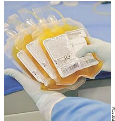
Método. En Saltillo, seis pacientes han mejorado por el plasma.

Hasta el momento, sólo en 6 pacientes ha funcionado este