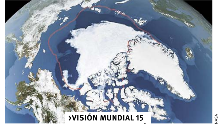
VISION MUNDIAL 15 ALERTA POR HISTÓRICO DESHIELO EN EL ÁRTICO