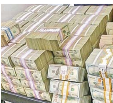
REBASA CRIMEN AL PAÍS EN LUCHA CONTRA LAVADO DE DINERO PRIMER PLANO 2

“Queremos aclarar cómo y quién pagó a los grupos que amenizaron y es parte de la información que hemos solicitado, porque no se trató de un evento común, hay la contratación de artistas y grupos musicales”, señaló Riquelme.