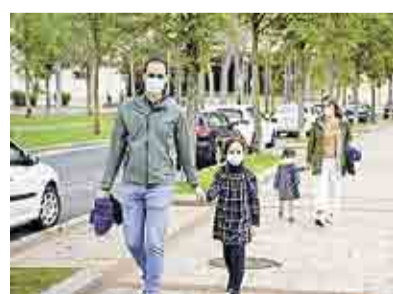
POR COVID ENDURECEN MEDIDAS NL Y DURANGO ESTADOS 11