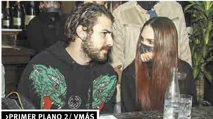
PRIMER PLANO 2/ VMÁS

36 páginas en 6 secciones • #15,973 • Ejemplar: 10.00 pesos