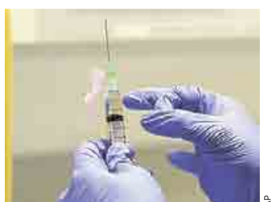
MUERE VOLUNTARIO DE VACUNA ANTICORONAVIRUS PRIMER PLANO 2

En la propuesta se planteó aumentar "un tanto", es decir, al doble, las penas por el delito de fraude, las cuales alcanzaban hasta 9 años de prisión.