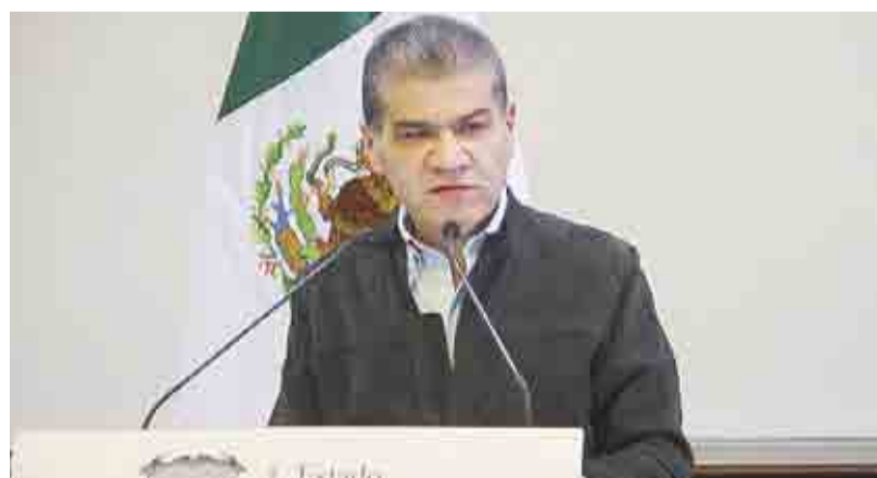
COAHUILA NO AUMENTARÁ NI CREARÁ IMPUESTOS PRIMER PLANO 2