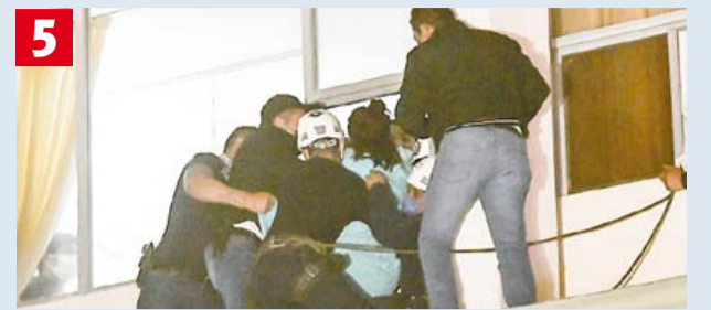
Más personal apoya para así meterla por una ventana.

HOY: ☀ 26°C máx. / 13°C mín. MAÑANA: ☀ 28°C máx. / 13°C mín.