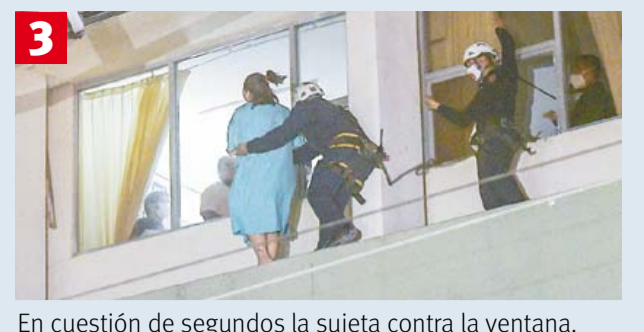
En cuestión de segundos la sujeta contra la ventana.