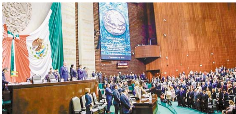
Votación. Este martes, el Pleno "discutirá" la reforma eléctrica de AMLO.

Por ello, precisó, los liderazgos camorales de Morena y sus aliados han desarrollado una estrategia que im-