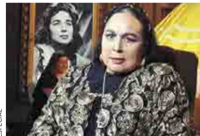
LA CANCIÓN MEXICANA PIERDE A FLOR SILVESTRE >VMÁS