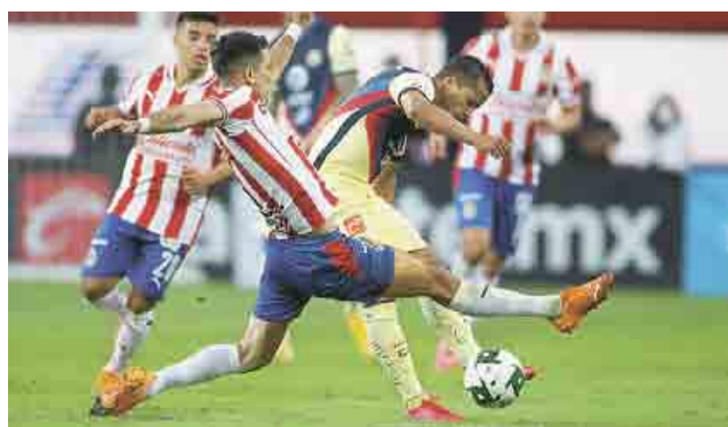
PEGA GUADALAJARA PRIMERO; PUEBLA SORPRENDE AL LEÓN >EXTREMO 3