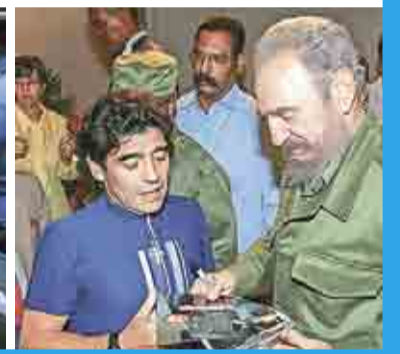
EXTREMO/PRIMER PLANO 2