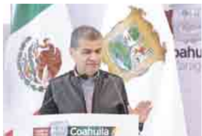
'CERO TOLERANCIA ANTE VIOLENCIA CONTRA MUJER' >PRIMER PLANO 2/ MI CIUDAD 5

Médicos consideran que el consumo de alcohol antes de los 18 años tiene graves riesgos, ya que a esa edad aun no se producen a un nivel considerable las enzimas implicadas en el metabolismo de esta sustancia, lo que genera impacto en la salud.