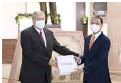
ENTREGAN GLOSA DE 3ER INFORME DE GOBIERNO >MI CIUDAD 3