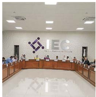
EL 4 DE ENERO INICIAN LAS PRECAMPAÑAS DE ELECCIÓN DE ALCALDES PRIMER PLANO 2

Violencia familiar, el delito que más se denuncia