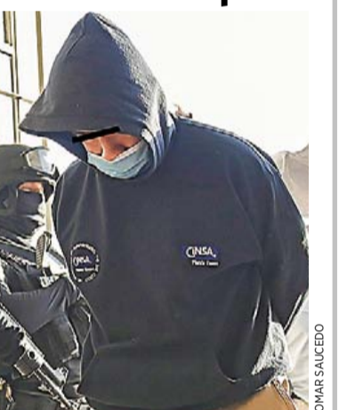
Caso. El próximo viernes, José "N" sería vinculado a proceso.

El Ministerio Público que formuló la acusación detalló que en la investigación se tomó declaración a 16 testigos y se dio a conocer que José tenía una relación cercana con Alondra desde hace seis meses.