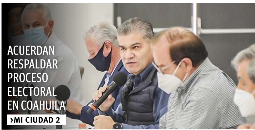
ACUERDAN RESPALDAR PROCESO ELECTORAL EN COAHUILA MI CIUDAD 2

"Vamos a actuar con mano firme, estaré muy pendiente de que este delito sea clasificado como feminicidio y que le den la pena máxima", sostuvo.