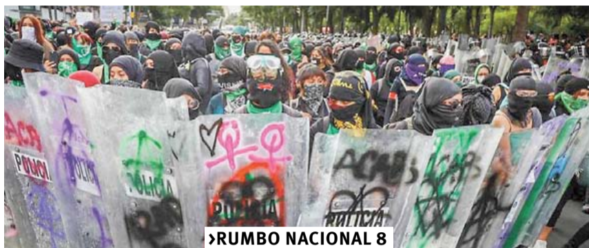
MARCHAN A FAVOR DEL ABORTO EN LA CDMX; MUJERES POLICÍAS RESULTAN LESIONADAS RUMBO NACIONAL 8