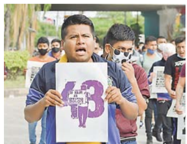
AYOTZINAPA: PROPONEN TESTIGOS PROTEGIDOS RUMBO NACIONAL 8

MATA COVID A ENFERMERA DE HOSPITAL DE PARRAS PRIMER PLANO 2