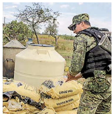
CÁRTELES CONTROLAN 6 PUERTOS MEXICANOS RUMBO NACIONAL 9

SE RECIBEN 150 LLAMADAS DIARIAS EN COAHUILA