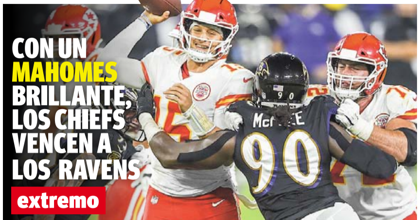
CON UN MAHOMES BRILLANTE, LOS CHIEFS VENCEN A LOS RAVENS extremo

40 páginas en 6 secciones • #15,950 • Ejemplar: 10.00 pesos