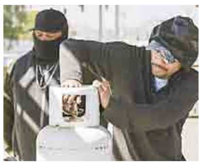
SE DISPARAN 50% COMPRAS EN GASERAS DE SALTILLO ►MI CIUDAD