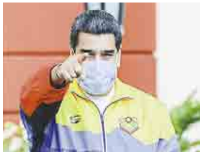
OFRECE MADURO SUMINISTRO SEGURO DE GAS A MÉXICO ►VISIÓN MUNDIAL 13