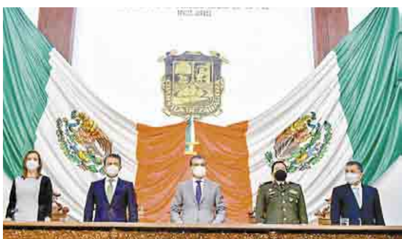
COAHUILA ES LA CASA DEL EJÉRCITO MEXICANO: MARS ►MI CIUDAD 8

Actualmente en el estado trabajan bajo este modelo semipresencial 78 planteles de preescolar, 48 de primaria y 32 de secundaria.