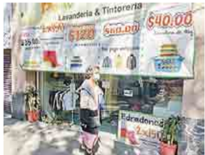
ECONOMÍA CAYÓ 4.4% EN ENERO, REPORTA EL INEGI ►EMPRESAS Y NEGOCIOS 15