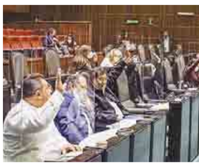
APRUEBAN EN COMISIONES REFORMA ELÉCTRICA DE AMLO ►RUMBO NACIONAL 4