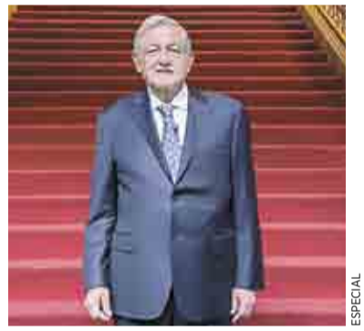
REAPARECE LÓPEZ OBRADOR TRAS DAR NEGATIVO A COVID >RUMBO NACIONAL 8