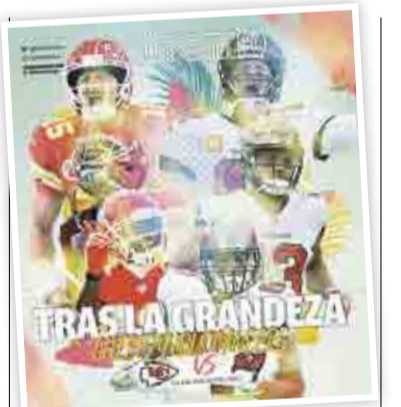
ESTE EJEMPLAR INCLUYE LA GUÍA DEL SUPER BOWL