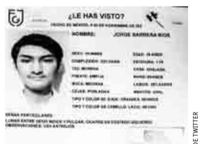
HALLAN A ESTUDIANTE TRAS 10 DÍAS DESAPARECIDO >AL CIERRE 11