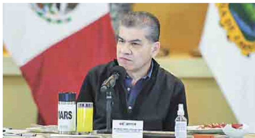
La entidad está proyectando obras por 5 mil millones de pesos para el 2021, bajo el esquema de Asociación Público Privada.