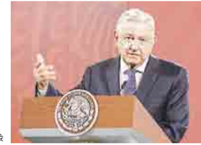
RECORTARÁ FEDERACIÓN AGÜINALDO A FUNCIONARIOS >RUMBO NACIONAL 10