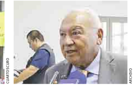
ASE EXPLICARÁ RETRASO EN DENUNCIA POR EL 'FICREAZO' >MI CIUDAD 2