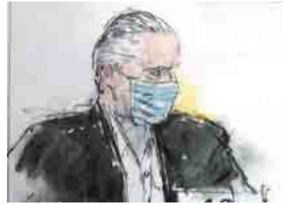
SALVADOR CIENFUEGOS SE DECLARA INOCENTE EN NY >RUMBO NACIONAL 9

44 páginas en 6 secciones • #15,988 • Ejemplar: 10.00 pesos