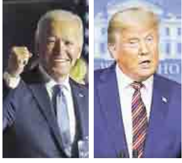
Las televisoras consideraron que el discurso era infundado.