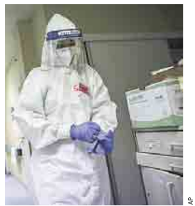
ALARMAN A LA OMS 530 MIL CONTAGIOS EN UN DÍA >VISIÓN MUNDIAL 19

Finalmente, aseguró que el valor de AHMSA ha caído entre 800 y 900 millones de dólares a raíz del proceso que se inició en su contra, acusado de blanqueo de capitales.