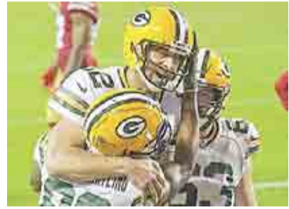
EMPACADORES DAN PALIZA A LOS 49'S DE SAN FRANCISCO >EXTREMO