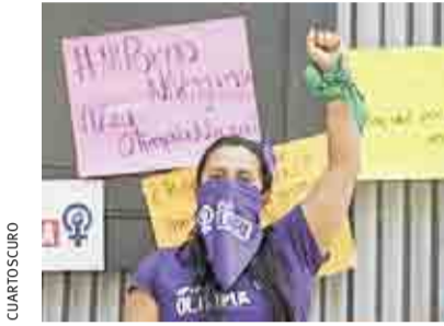
APRUEBAN SENADORES LA LEY OLIMPIA PARA TODO EL PAÍS >RUMBO NACIONAL 10