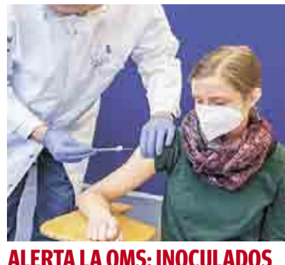
ALERTA LA OMS: INOCULADOS PODRÍAN TODAVÍA CONTAGIAR >VISIÓN MUNDIAL 13