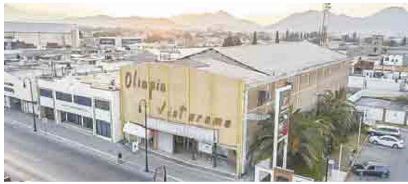
51 AÑOS DEL OLIMPIA, SUS GLORIAS ANTES DEL CINE DE ADULTOS >MI CIUDAD 4-5