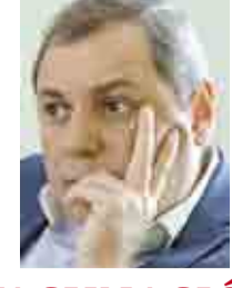
'VACUNACIÓN, ATENÚA RIESGO O NOS TUMBALA ECONOMÍA' >ESPECIAL 10