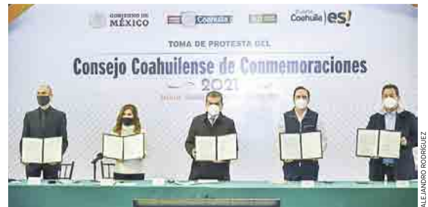
INSTALAN CONSEJO PARA COORDINAR FESTEJOS HISTÓRICOS >MI CIUDAD 5