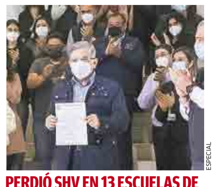
PERDIÓ SHV EN 13 ESCUELAS DE SALTILLO; ARRASA EN TORREÓN >MI CIUDAD